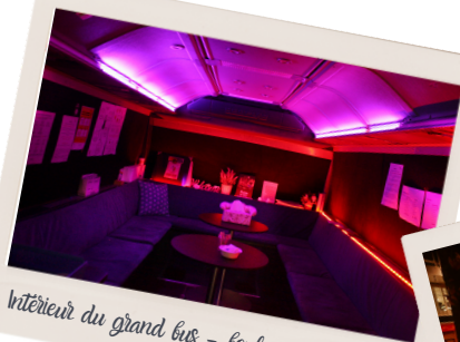
Intérieur du grand bus - boulevard Helvétique