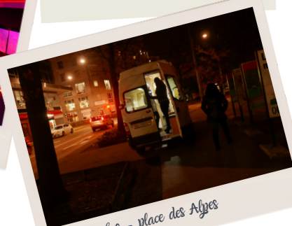
Petit bus - place des Alpes