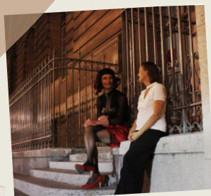
Équipe du podcast "Les jeudis du Boulevards"

https://open.spotify.com/show/3g983fRaWchDxEcqCqHkNl